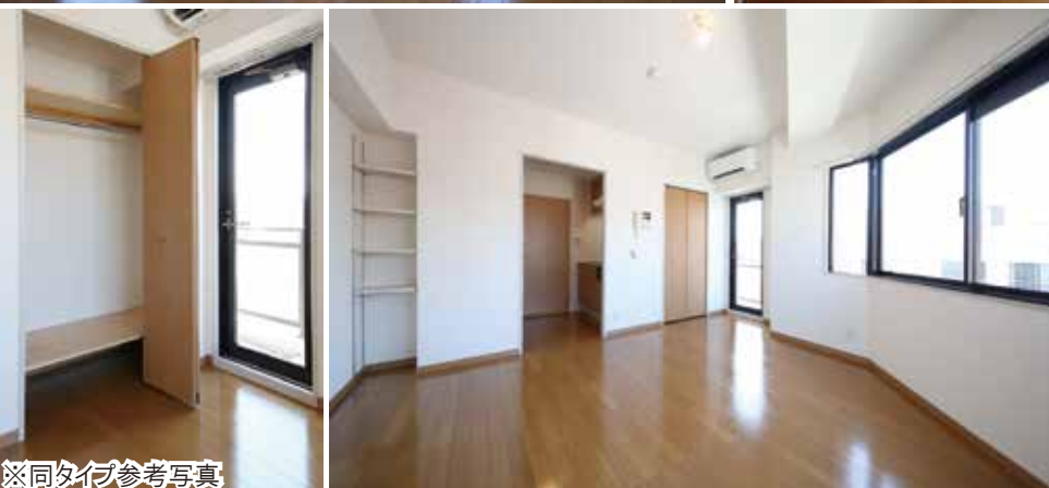
※同タイプ参考写真