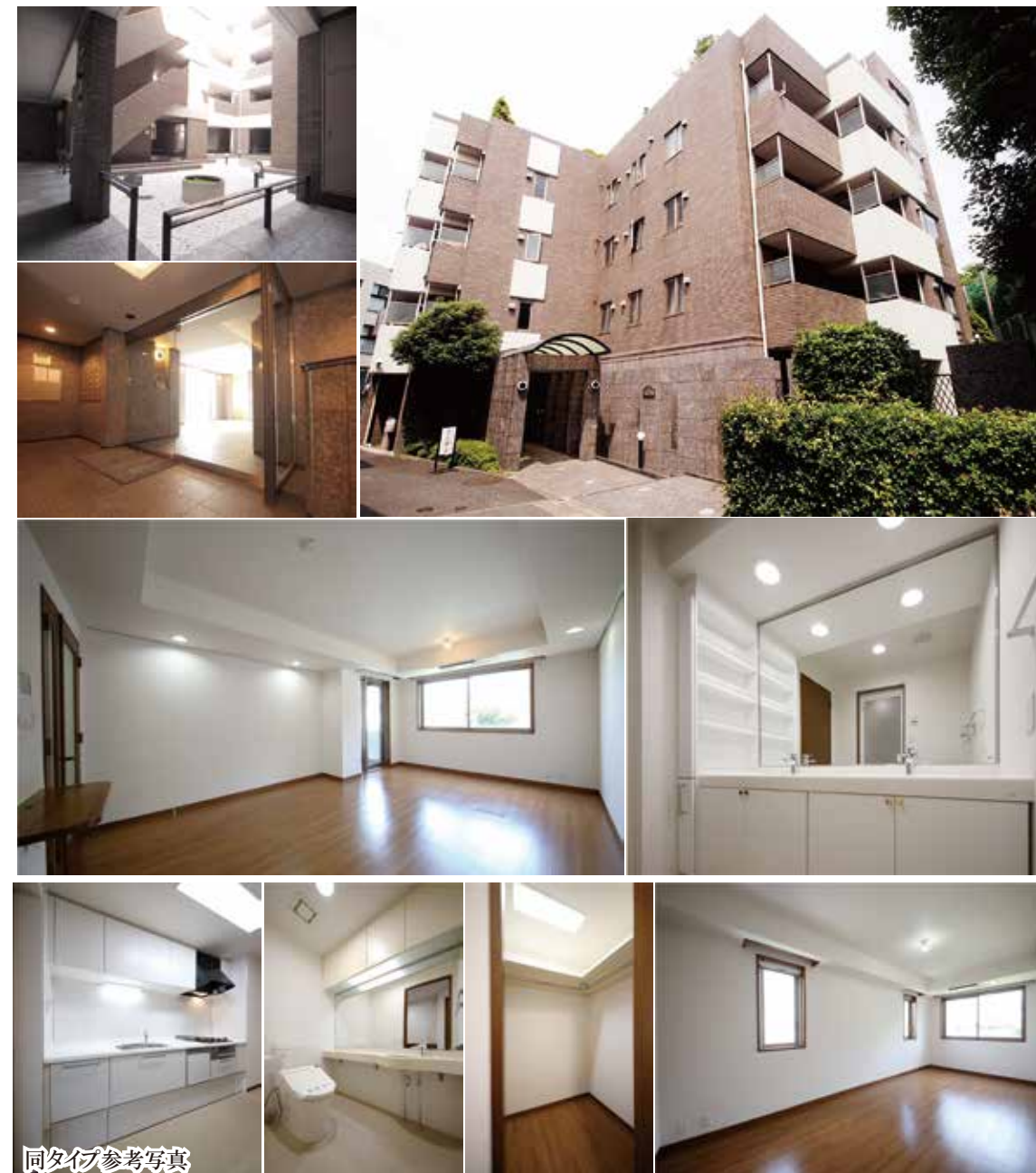
同タイプ参考写真