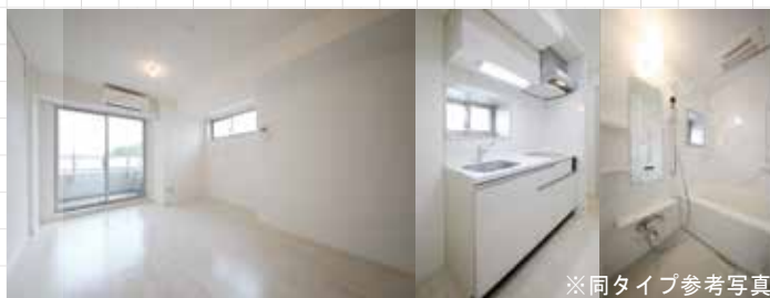
※同タイプ参考写真

(株)アクセス・リアルティ 公式HPにて詳細・写真公開中 https://access-r.co.jp/