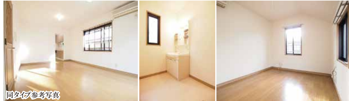
同タイプ参考写真