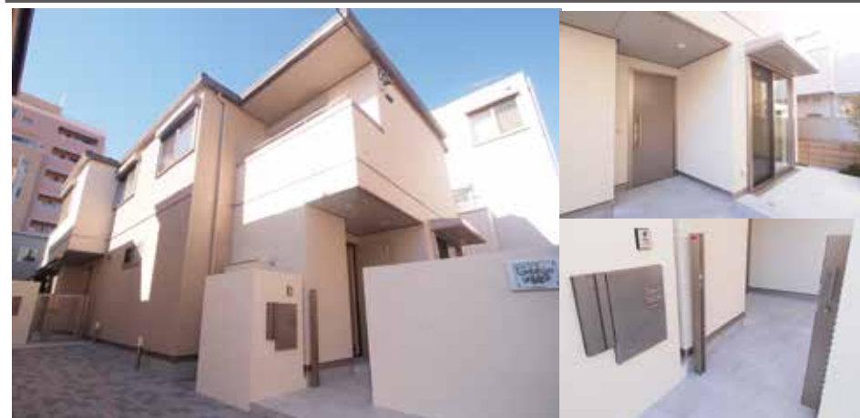
Rental Terrace house