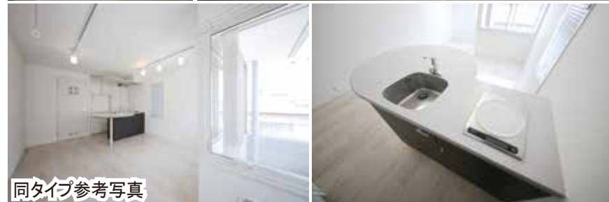
同タイプ参考写真