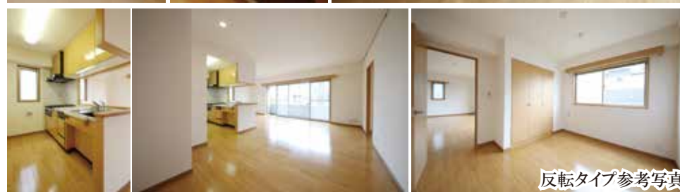
反転タイプ参考写真