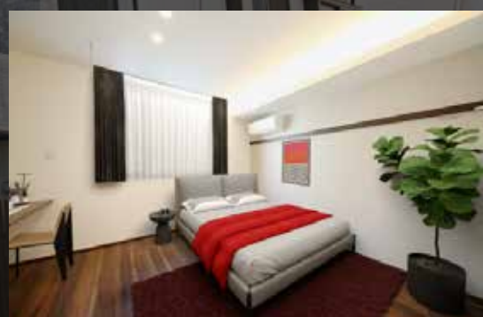
※バーチャル写真内のインテリア等は含みません

(20.44坪) 2LDK 67.59m 2 201 | 賃料 310,000 円/月 (共益費 9,000 円) 契約開始日は、申込日より最長2週間以内でご設定ください。