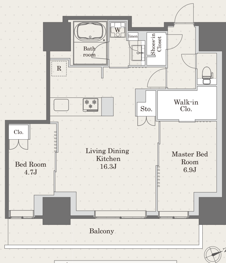
L type Room Color : Natural 2LDK 65.24 m 2 (19.73坪)