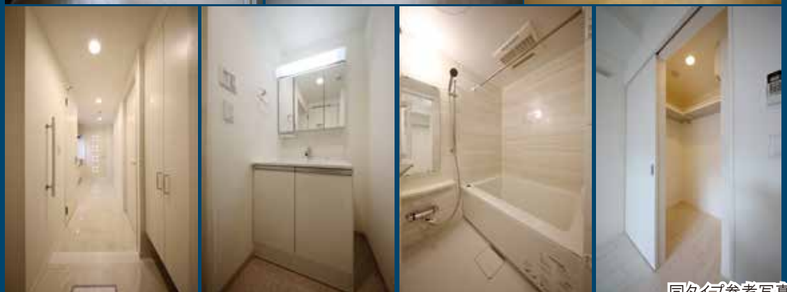
同タイプ参考写真