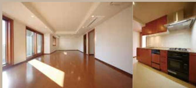
※同タイプ参考写真