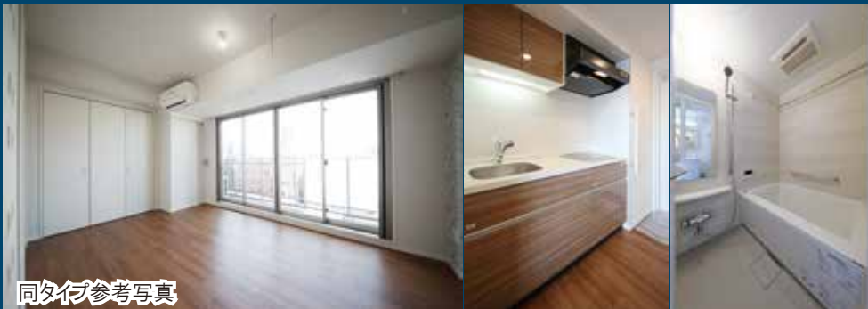
同タイプ参考写真