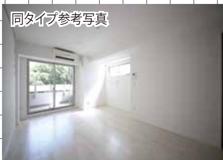
同タイプ参考写真