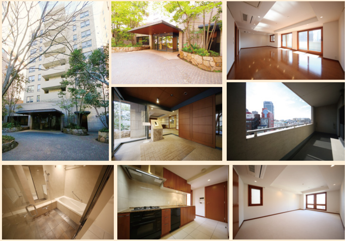
※現況と図面が異なる場合は現況を優先いたします